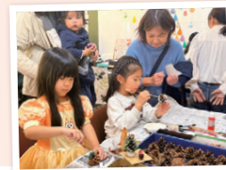
松ぼっくりでクリスマスツリー作り♪

つどい場CÖ・KÖで活動するグループや大学生がクリスマス会を開催しました。プチケーキのデコレーション、塗り絵、ミニツリー作りなどのブースは、親子を中心に地域の人たちで大にぎわい。「上手にできた!」と、笑顔の子どもたちを眺める保護者もにっこり。最後はみんなでクリスマスソングを歌いました。(行本)