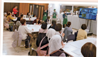
1年の生産の流れを映像で紹介

北海道訓子府町からコープこうべフードプランの「たまねぎ」「じゃがいも」の生産者を招き、交流会を開催しました。参加者からは現場の苦労や工夫について、次々と質問が。生産物を使ったガレットも試食しました。「おいしい！」という参加者の声に、生産者は「喜んでもらえることが励みになる」と語りました。(行本)