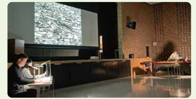
「きり絵画文集『原爆ヒロシマ』」の朗読劇の上映会