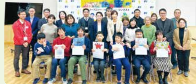
「玉津のつどい場 たまろっと」で開催したアート作品の表彰式

神戸市西区の「玉津のつどい場 たまろっと」では、地域の障がいのある方から募集した300を超える作品を展示。優秀作品を選び、カレンダーを制作し販売しました。誰もが活躍できる社会になるよう取り組んでいます。