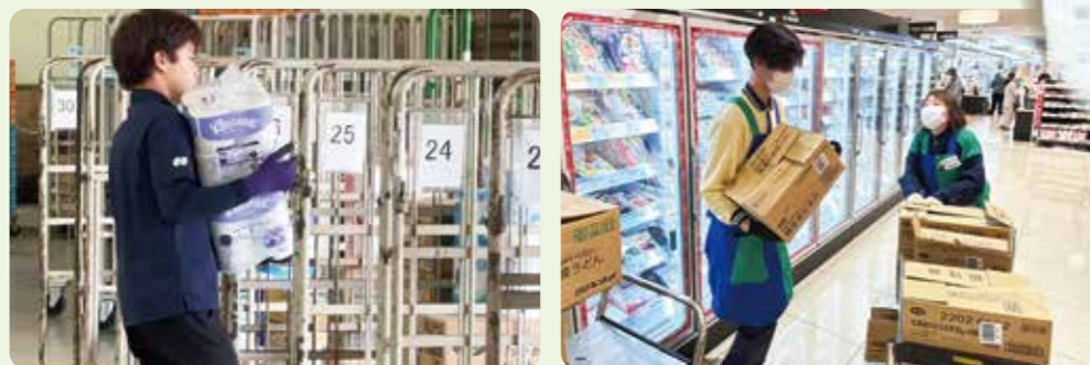
宅配の商品出荷や店舗の品出しで活躍する職員(左:協同購入センター但馬、右:コープデイズ豊岡)

また店舗や地域で宅配商品の受け渡しを行う「めーむひろば」では、障がい者支援団体と共同作業で運営している拠点が、17カ所に増えました。これからも障がいのある方の活躍の場を広げていきます。