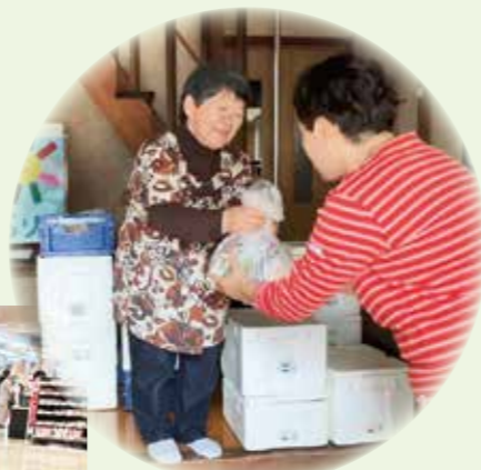
地域めーむひろば「そらりす」(新温泉町)で商品の受け渡しを行う福祉施設の利用者