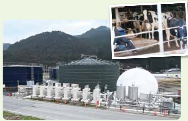
本稼働準備をすすめる「コープ箸荷バイオガス発電所」(多可郡多可町)

乳牛のふん尿が発酵することで発生するメタンガスを活用した発電施設「コープ箸荷バイオガス発電所」の本稼働準備をすすめています。発酵後の牛ふん尿から副産物として得られる消化液(液状堆肥)は地域の農業用に利用されます。エネルギーの地産地消を推進する「コープでんき」の電源開発に加え、地域資源を循環させる新たな事業モデルとしてエネルギー、食と農畜産業などのつながりを学ぶ環境学習の拠点に位置付けていきます。