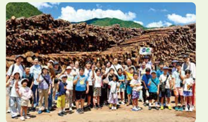
地元木材を原料とした朝来バイオマス発電所の見学会

「誰一人取り残さない、持続可能な社会の実現」に向け、SDGsをテーマに、再生可能エネルギーやリサイクルについて学べる見学会を開催。夏休みの自由研究を目的にするなど、68人の組合員親子が参加しました。西コースでは「朝来バイオマス発電所」と「リスパック(株)関西工場」を見学。東コースでは「(株)宝塚すみれ発電」と「鳴尾浜リサイクルセンター」を訪れ、環境保全の取り組みについて学びました。