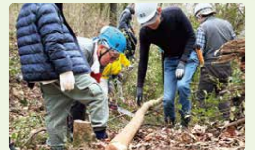
社家郷山での伐採活動の様子