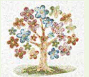
組合員から寄せられた作品をつなぎ合わせたモザイクアート

終戦80年の節目を迎え、戦跡への旅や平和の映画会、学習会の企画を増やし、組合員と共に、平和の尊さを考える機会をつくりました。また平和への思いを表現したイラストや写真を募集。約300点が寄せられ、これらの作品をつなぎ合わせてモザイクアートを制作しました。アートを通して、平和への思いを未来につなげていきます。