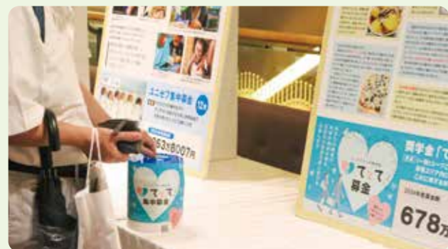
奨学金「てとて」に募金をする組合員

コープこうべの奨学金「てとて」を通じて、修学継続と将来の夢の実現を応援しています。「てとて」は2021年、コープこうべ創立100周年を機にスタートした返済不要の奨学金制度です。コープこうべの事業エリアに居住する、高等学校、高等専門学校、特別支援学校、ならびにこれに準ずる学校に在籍する生徒を対象に、月額1万円を卒業まで給付。2025年度末の奨学生は255人で制度創設以降、158人が高校等を卒業し、進学や就職など、新たな道を歩み始めています。