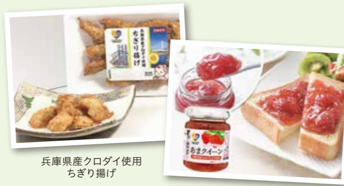
兵庫県産クロダイ使用 ちぎり揚げ

規格外原材料の有効利用、地域の活性化、工場の稼働促進など地域の課題を解決するために、生産者、取引先と協働で開発をすすめる「CO・OP NEXT100商品」。春によく獲れるものの、脂乗りが悪いため需要の少ないクロダイを使って、神戸市漁協とカネテツデリカフーズ(株)とともに「兵庫県産クロダイ使用ちぎり揚げ」を開発しました。低利用魚をおいしく有効活用した商品です。他に、余剰・規格外品のいちごを使った「兵庫県産あまクイーンいちごジャム」などもデビューしました。