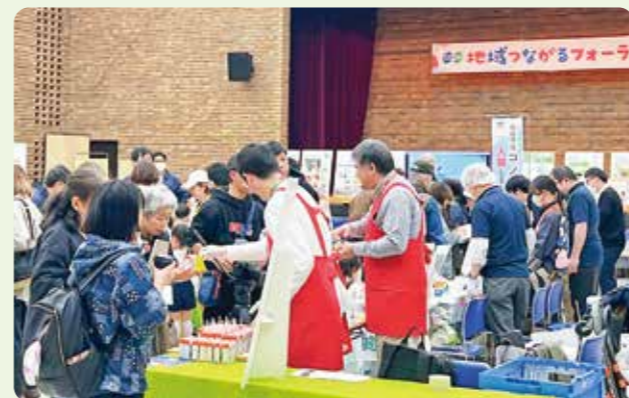
出展ブースを回る組合員

くらしが環境に及ぼす影響に注目し、日々の買い物や利用するサービスを見直そうと、「地域つながるフォーラム2025」を開催しました。協同組合や行政、企業、地域団体など多様な団体がブースを出展。約400人が参加し、産地の課題解決をめざす商品や資源の有効活用などについて楽しく学びました。「子どもたちが学べるブースがたくさんあり、コープのファンになりました」といった声が寄せられました。