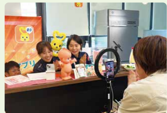
LIVE配信に出演する宅配の地域担当

コープこうべアプリを活用し、組合員との新たなコミュニケーション企画「LIVE配信」を始めました。宅配の地域担当や店舗の職員がバイヤー、メーカーの皆さんと共に、商品紹介などを行う配信の企画。視聴者から「いいね」やチャットコメントが届き、商品の購入にもつながっており、宅配で留守にされている組合員や若い世代との接点になっています。