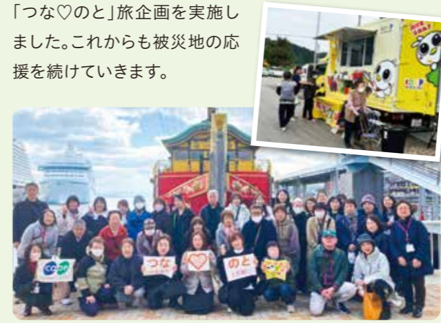
「つな♡のと」旅企画に参加した能登の皆さん

また3月には、募金を活用し、被災地の皆さんに姫路や神戸で観光や食事を楽しみ、日頃の疲れを癒してもらう「つな♡のと」旅企画を実施しました。これからも被災地の応援を続けていきます。