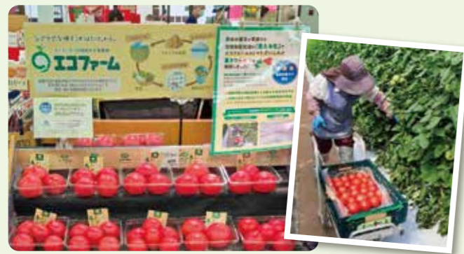
星3つを取得したことを知らせる店舗のトマト売り場

今後も、将来にわたり安心して暮らせる社会の実現をめざし持続可能な食料生産に貢献していきます。