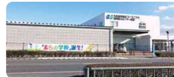
「まちの学校」の開設を横断幕でお知らせ