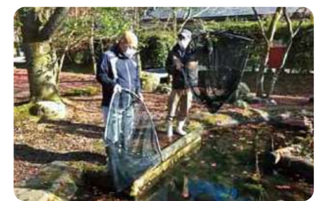
助成先団体「丹波地域のホトケドジョウを守る会」個体数調査のようす

11月には、「コープこうべ環境基金オンライン市民団体交流会」を開催。助成先団体の事例発表会では活動されている現場からの中継もあり、臨場感のある発表となりました。