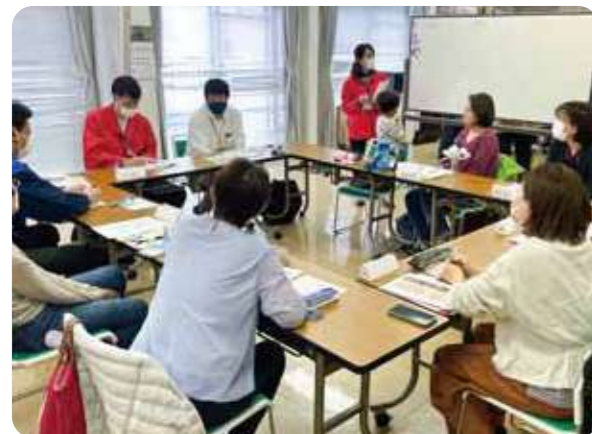
地域でできることについての話し合い(コープ箕面中央)

2022年2月からスタートした「地域つながるミーティング」は、総代や地域コープ委員会、サークル活動を行う組合員だけでなく、行政や社会福祉協議会、NPOなどの団体、地域で活動する個人やグループが参加し、対話を通じて人や組織がつながる場です。