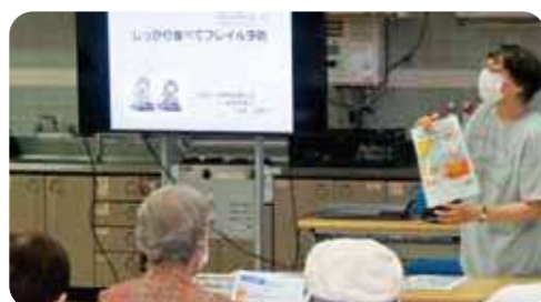
フレイルを予防する食生活についての学習会(コープ宝塚)