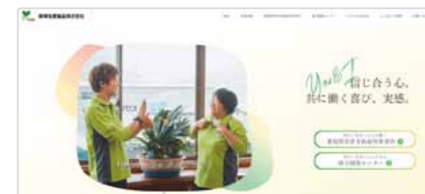
阪神友愛食品(株)のホームページ