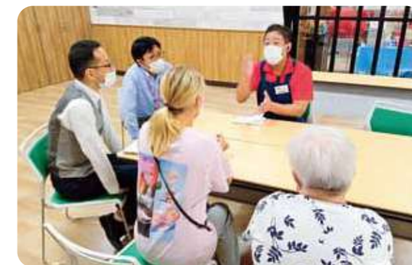
避難民の方の就労に向けた面接を実施(コープ北鈴蘭台)

ウクライナから避難されている方の生活を応援するため「ハート基金(コープこうべ災害緊急支援基金)」から拠出しています。行政や地域団体などと連携しコープこうべの活動エリアに避難されている方に呼びかけ。その中で組合員になっていただける方を対象に、コープこうべの店舗で使える電子マネー10万円分を拠出金でチャージした「コピーカード」を、2022年度は56世帯に各1枚お渡ししました。一部の避難民の方は、店舗で就労もされています。