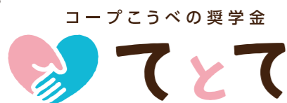
コープこうべの奨学金