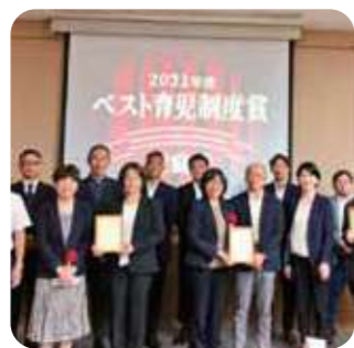
イクハク ベスト育児制度賞 受賞式の様子

9月には育児世代向けのWebサイトを運営する一般社団法人日本子育て制度機構から、「2021年度イクハク ベスト育児制度賞」を受賞しました。これからは次世代を担う若者の学びや活動、夢の実現を応援していきます。