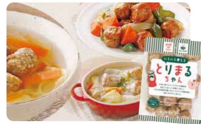
いろいろな料理に使える「とりまるちゃん」