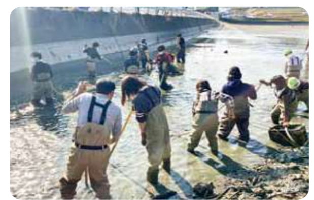
湊里の西ノ池で泥をかき出すボランティアの皆さん

これからも地元の食材や地域の豊かさを、協同の力で守っていけるよう取り組んでいきます。