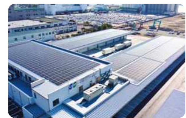
協同購入センター東神戸の屋上の太陽光パネル

活動エリア内には、再生可能エネルギー普及のために44カ所の太陽光発電所が稼働しています。2023年1月に新設した協同購入センター東神戸では、屋根に設置した太陽光パネルで発電された電気を事業所内で使用する自家発電・自家消費に取り組んでいます。