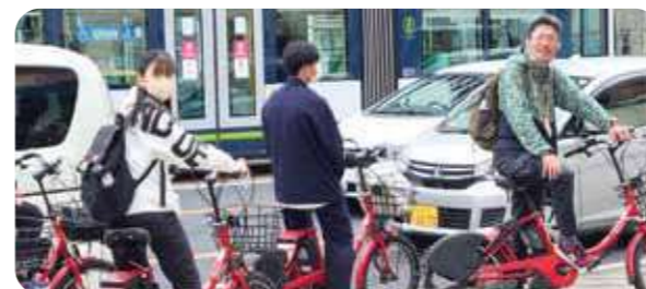
広島の被爆地域を自転車で巡る高校生