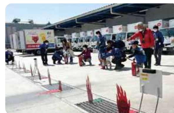
協同購入センター東神戸の構内で行われた消火訓練

災害が起きたときに実践できるよう、身近にある牛乳パックやペットボトルを利用し、防災グッズづくりや活用方法を紹介するなど、お子さんにも分かりやすく、楽しく学びました。地域の防災拠点としてのあり方を考える機会にもなりました。