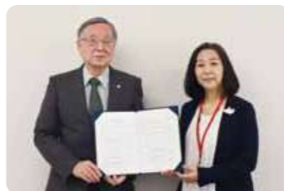
西宮市社会福祉協議会と協定締結