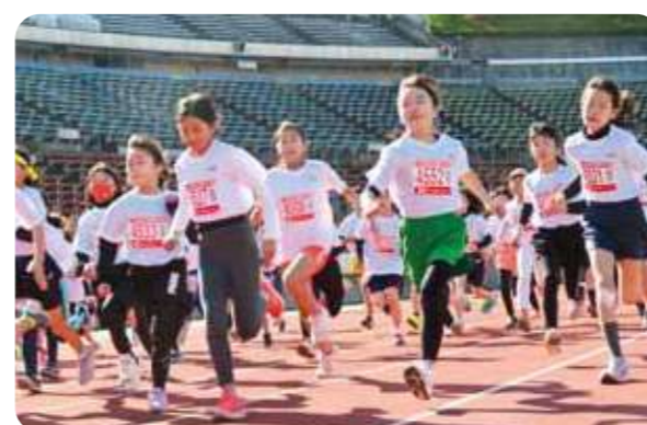
スタートの号砲で元気に駆け出す4年生

暖かい日差しの中、学年・男女別に準備体操をした後、沿道からの熱い応援を受け、力強く走る姿が見られました。参加した小学生は「疲れたけど楽しかった。来年もまた参加したい」と笑顔で話していました。