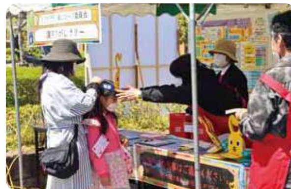
フェスタの受付を担当する地域コープ委員会の皆さん

丹波篠山市社会福祉協議会との買い物困難者等への支援協定を受け、地域の団体や企業、学校、地域コープ委員会が連携し、SDGsをテーマに「つながろうフェスタ」を開催。800人を超える方が来場され、持続可能な社会のあり方や地域のつながりの大切さを感じました。