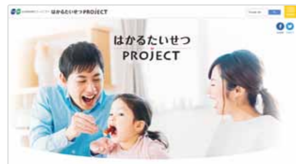
ホームページでさまざまな取り組みを紹介