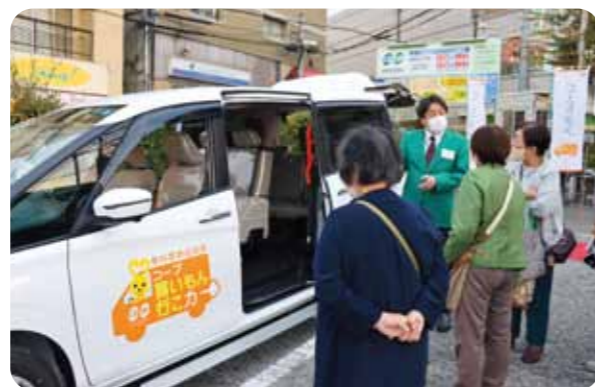
コープ宝塚で「買い物行こカー」の運行を開始