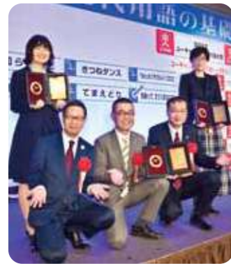
12月1日、流行語大賞の発表・表彰式の様子

「てまえどり」が「現代用語の基礎知識 選 2022ユーキャン新語・流行語大賞」トップ10に選ばれました。発表・表彰式には、全国に先がけて取り組んできたコープこうべと神戸市の代表者のほか、コンビニエンスストアで「てまえどり」を呼びかけた一般社団法人日本フランチャイズチェーン協会や農林水産省も参加しました。