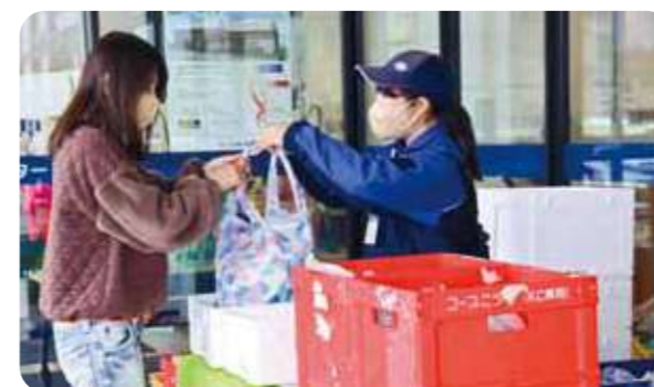
JA兵庫六甲の支店で行われている「地域めーむひろば」

また、加東市や小野市、宍粟市などの神戸新聞販売店とも連携し、「地域めーむひろば」を広げています。毎週の商品の受け渡しを通じて交流が生まれ、つながりの場となることをめざしています。