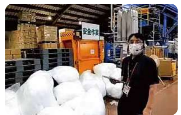
オンライン学習会のようす(玉津リサイクルセンター)

西宮市鳴尾浜と神戸市西区玉津町にある2つのリサイクルセンターをオンラインでつなぎ、見学会を開催しました。当日は62人の組合員親子が参加。「オンラインなので、1度に2つのリサイクルセンターが見学できて良かった」「今日からできるリサイクルの取り組みについての理解が深まった」などの感想が寄せられました。また、夏休みの自由研究にも活用されました。