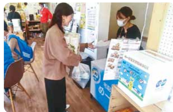
新しくオープンした「ここおる」で宅配商品の受け渡しを開始