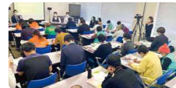
災害時に役立つ調理や備蓄の大切さを伝えるワークショップ