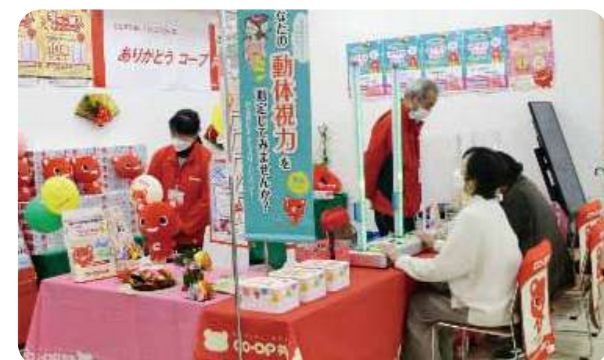
店舗で動体視力を測定