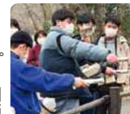
福島県で放射線量測定を体験

同じく3月、東日本大震災の被災地の人たちから学ぶ「虹っ子平和スタディツアーin福島」を開催。中学・高校生17人が参加し、福島の現状や情報の大切さ、福島の食の安全性などを学びました。旅のようすは、ワカモノ応援サイト「Konoyubi」に掲載しています。