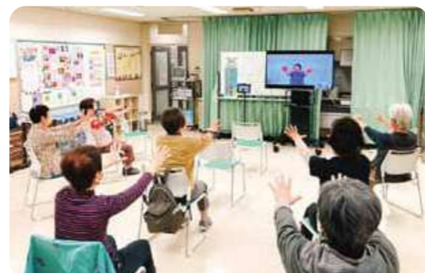
椅子に座ったまま行う「しんしん体操」(コープ福田)

第5地区の店舗から始まった体操は、地域福祉センターでも実施されるなど、地域にも広がりつつあります。