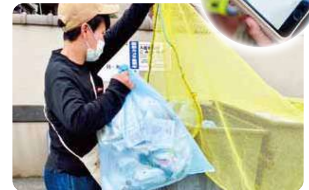
「たすけタッチ」を通じてゴミ出しをお手伝い