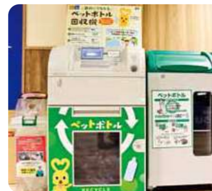
寄付機能付きペットボトル減容回収機（コープ西宮南）

2022年度は西宮市内の3店舗で集まった寄付金（13万8318円）を武庫川の自然環境の保全や治水対策に取り組む「21世紀の武庫川を考える会」に寄付しました。