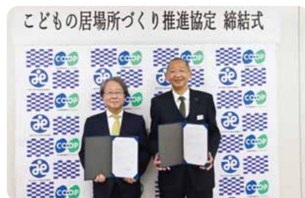
3月3日に行われた協定締結式

神戸市社会福祉協議会(以下、社協)と「こどもの居場所づくり推進協定」を締結しました。近年、子ども食堂などの居場所が増え、市民や企業から社協に届く支援物資も増加。それらの物資を受け入れ、支援団体に提供する拠点として、神戸市内にある宅配や店舗の施設を活用していきます。今後も社協・支援団体との交流を深め、地域で子どもたちを見守る力を強めていきます。