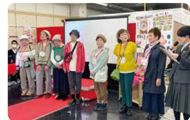
ファッションショー「あ・い・コレ2023」に参加したモデルの皆さん(コープデイズ相生)