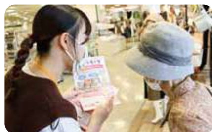
フードドライブを呼びかける大学生

フードドライブは家庭で使い切れない余剰食品を、宅配や店舗にて無償で引き取り、フードバンクや子ども食堂などを通じて食の支援を必要とする方に提供する取り組みです。コープミニを除く全ての店舗（コープミニルミナス箕面では実施）で常時、受付を行っています。9月と1月には、全ての協同購入センターと店舗で集中受付キャンペーンを実施。年間で約44トンの食品が組合員の皆さんから寄せられ、必要とする方たちの支援につながりました。