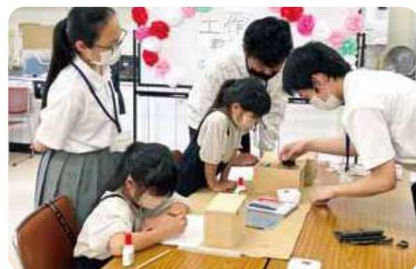
オルゴールボックスと一緒に作る小学生と高校生

「子ども工作教室」には4歳児から小学生までが参加。電気科の学生たちと一緒にオルゴールボックスを作りました。「作るの簡単だけど、教えるとなると難しい」と講師役の高校生にとっても良い経験となりました。