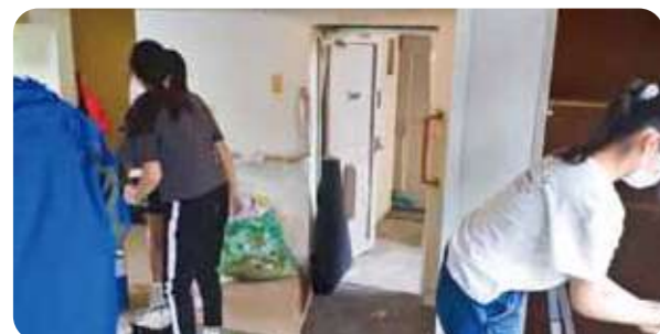
空き部屋の片付けをして活用

第1地区では、コープこうべと尼崎市、コープこうべとつながりのある支援団体で協定を結び、「あまがさき住環境支援事業REHUL(リーフル)」が始まりました。尼崎市の市営住宅の空室をさまざまな支援団体の活動の場として活用する取り組みです。趣旨に賛同する支援団体には市営住宅の使用が認められ、シングルマザーや留学生などの住居、活動のための事務所などとして使用されています。3月末現在、ネットワーク団体は16団体に広がっています。