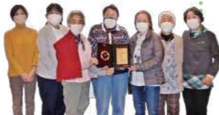
第1地区「e買うプロジェクト」の皆さん

将来にわたり安心して暮らせる社会をめざす、組合員発の取り組みが高く評価されました。