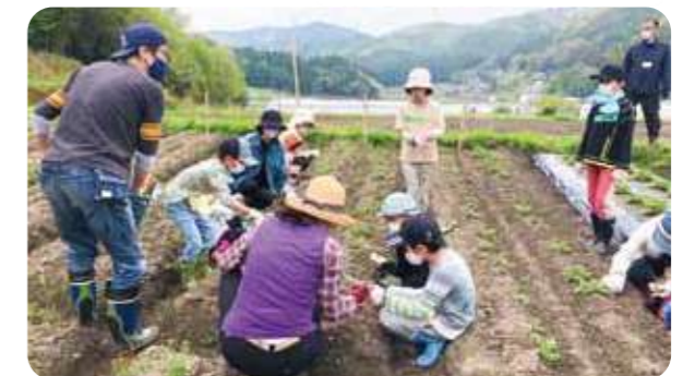
「みんなの牧心プロジェクト」の活動の様子