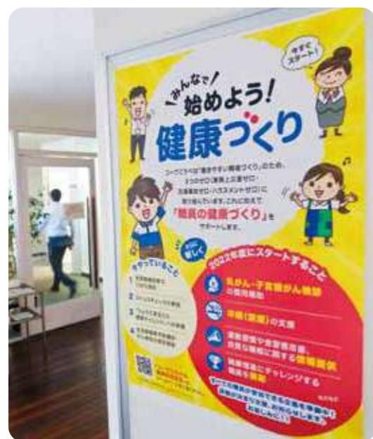
健康づくりを啓発するポスター