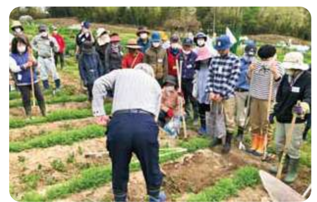
うねづくり・除草作業の実習のようす