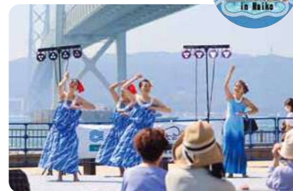
海をバックに日頃の活動を披露