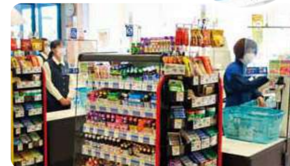
マスク着用で勤務する職員(コープ甲東園)