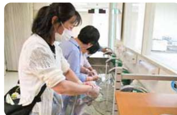
商品検査センターの見学会で手洗いの実習

感染症対策を行う上で手洗いはとても重要です。見た目では汚れていなくても、細菌やウイルスなどが付着している可能性があります。手順や洗い方を見直し正しい手洗いを行うことで、洗い残しが少なく、より清潔になることを実習も交えて学んでいます。