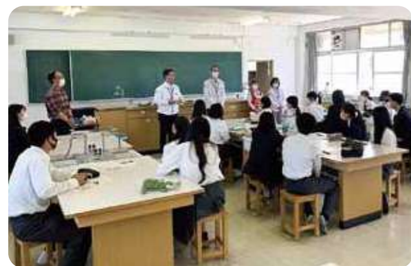
地域課題について高校生にアドバイスする職員

地区本部や店舗の職員が参加し、SDGsや地域連携などの課題について高校生たちと学び合いました。