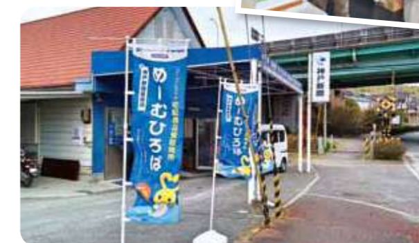
「地域めーむひろば」を実施している神戸新聞販売店