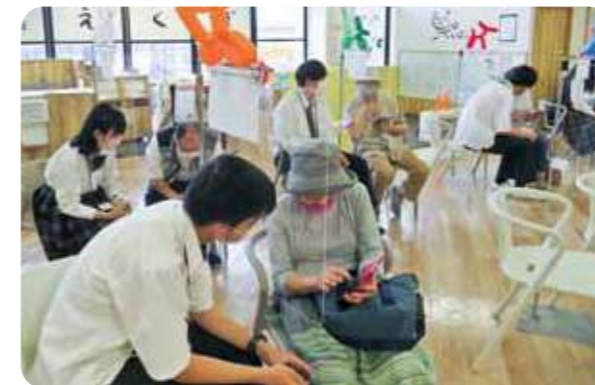
高校生がスマホの使い方をアドバイス