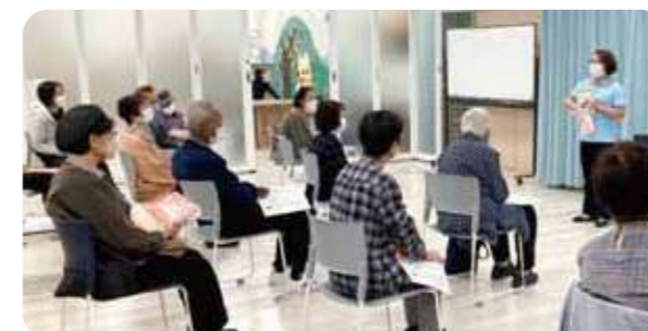
「健康チャレンジ運動コース」の取り組みとして「フレイル予防体操」を実施