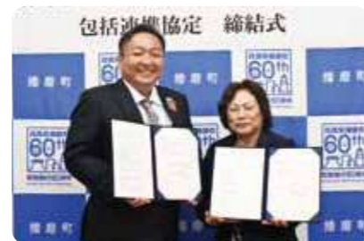
播磨町と協定締結

2022年度は高砂市や播磨町、各地の社会福祉協議会(豊岡市・西宮市・神戸市)とも協定を結びました。