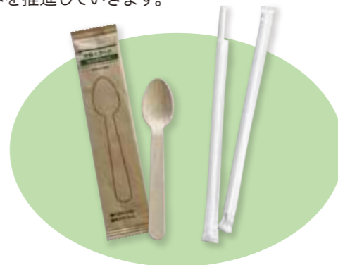
木製スプーンと紙製ストロー

レジやサービスコーナーにお申し出いただいた場合のみ、木製または紙製のスプーン、紙製のストローを無料で提供しています。今後もプラスチック削減の取り組みを推進していきます。