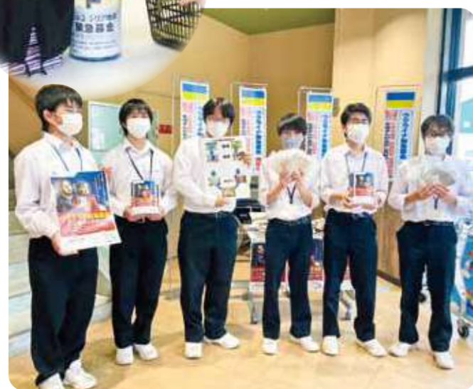
ウクライナ緊急募金を呼びかける県立三木北高校の皆さん (コープ三木緑が丘)