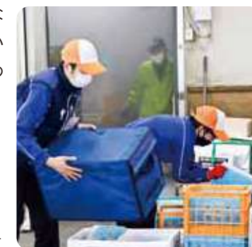
協同購入センター西宮での倉庫作業

特例子会社「阪神友愛食品株式会社」のサポートを受けながら、多様な人を認め合う優しい職場づくりをすすめています。