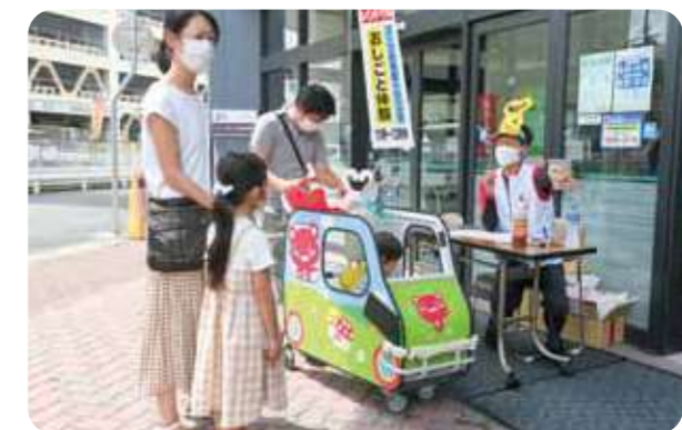
宅配と店舗の職員が合同で行った「レインボーひろば」(コープデイズ神戸西)