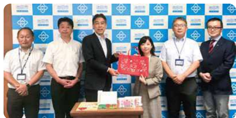
池田市と協同で取り組みを発表