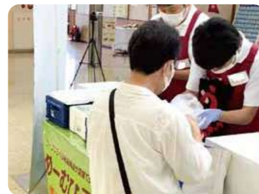
商品の受け渡しを行う福祉事業所の利用者

これからも福祉事業所との連携や障がいのある方の活躍の場づくりをすすめていきます。