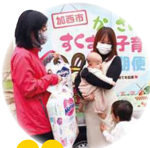
親子の見守りを兼ねて育児用品をお届け

また、池田市の子育て支援の取り組みに賛同し、出産祝品の提供を始めました。出生届を提出された際、市役所の職員が窓口で祝品としてガーゼハンカチ、フリーザーバッグ、おしりふき2パック、サーモボトルを渡しています。