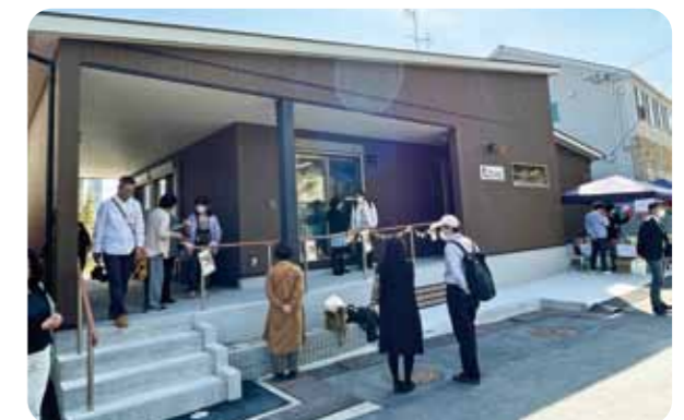
「CO・KO(ここ)」、オープン当日のようす

コープ甲東園(西宮市)のリニューアルオープン後、地域の方々が新たに出会い、交流できるつどい場づくりに向けて1年間、協議を行いました。大学生や地域の活動者、子育て中の方のグループなど14の団体がそれぞれの思いを伝え、これまで交流がなかった団体同士がつながるイベントも実施し、2023年4月につどい場をオープン。名称は「CO=コープ、コミュニティ(地域)」「KO=甲東園」の意味を含め、「コープのつどい場『CO・KO(ここ)』」に決まりました。