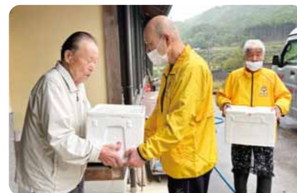
豊岡市社会福祉協議会と協働でサービスを開始