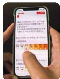
食習慣調査にスマートフォンで手軽に参加