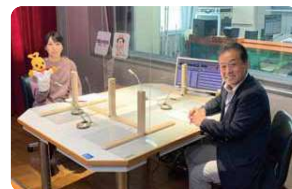
「コープ・スコープ!」を収録するスタジオ(ラジオ関西)