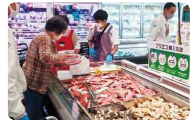
持参した容器に商品を入れる組合員（コープ龍野）

第7地区では、使い捨てプラスチックの使用量を削減するための取り組み「プラエコデー」を各地で開催しています。コープ龍野やコープデイズ豊岡では、エビやホタテ、鮭などの商品をバラ売りで提供し、自宅から持参した容器に入れていただく企画を開催。食品トレーやフィルムなどのプラスチック削減につながりました。今後もこのような環境に配慮した取り組みを広めていきます。