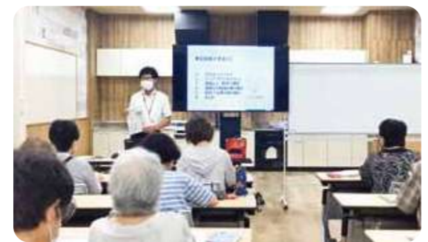
SDGsや環境の取り組みについての学習会

生協をはじめ協同組合が大切にする「一人は万人のために、万人は一人のために」という理念はSDGsをめざす「誰一人取り残さない」という世界観と相通じます。これからも持続可能な社会の実現に向け、学習の輪を広げていきます。