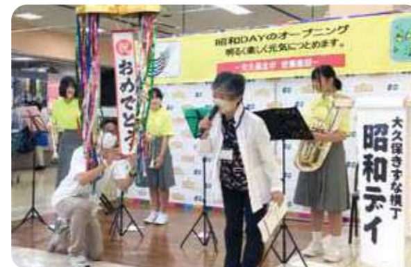
イベント開催のあいさつのようす

コープ大久保では「地域つながるミーティング」での対話をきっかけに、地域の活動者や民生委員・児童委員、社会福祉協議会、組合員などが集まり、「レトロ」をキーワードにしたイベント「昭和DAY」を開催。のべ400人以上の方が来場され、世代を超えてつながりました。