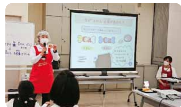
小学生の食習慣調査を行い、食生活の大切さを伝える学習会(第1地区本部)