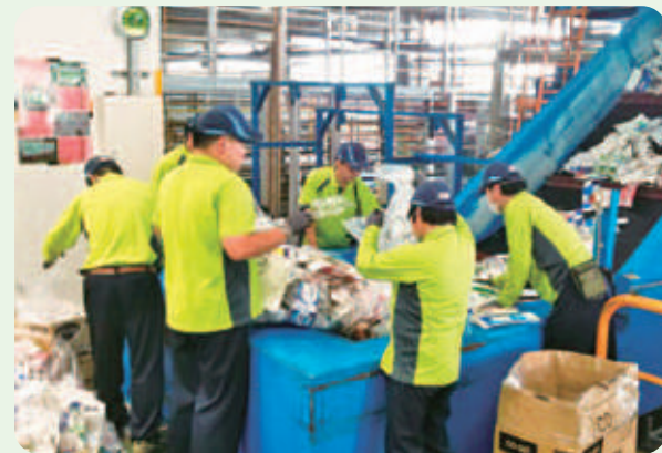
障がいのあるスタッフによる紙パックの圧縮作業のようす

8月27日(金)に開催した「親子でつながる！コープのリサイクルセンターオンライン見学会」では、親子を中心に112人が参加。鳴尾浜リサイクルセンターと玉津リサイクルセンターをオンラインで見学し、容器包装や紙資源のリサイクルについて学習しました。