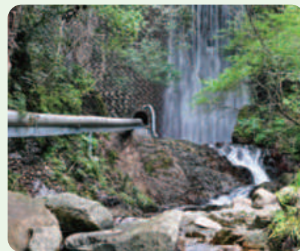
小水力発電所の取水口

さらにコープ西宮南(西宮市)、コープ大久保(明石市)、コープ上郡(赤穂郡)、コープ安倉(宝塚市)の4店舗に、自家消費型太陽光発電設備を設置しました。