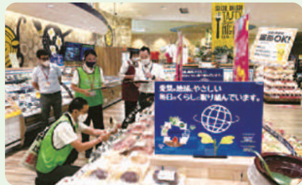
オンライン見学会で店内を撮影するようす

また、8月6日(金)にコープ西宮南(西宮市)のオンライン見学会を開催し、45人の組合員が参加。各部門担当者が、プラスチック使用量削減やリサイクル回収の取り組みなど、環境配慮の取り組み事例を紹介しました。