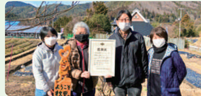
大阪府知事から感謝状をいただきました

また、新たに3つの地域コープ委員会が牧里での活動を開始するなど、参加の輪が広がっています。これらの継続的な取り組みが評価され、大阪府知事から感謝状が贈呈されました。