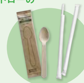
木製スプーンと紙ストロー

レジやサービスコーナーにお申し出いただいた場合のみ、木製または紙製のスプーン、紙製のストローを提供する運用に変更し、年間約200kgのプラスチック削減に取り組めます。