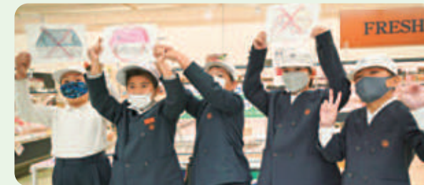
小学生による呼びかけ

11月、コープ龍野(たつの市)では、地域NPO法人と地元小学校との共催で「プラエコデー」を開催しました。自宅からバラ売り商品を入れる容器を持参しての買い物促す取り組みで、小学生が事前にプラスチック問題などについて学習。その学習成果を来店組合員に発表しながら、取り組みへの参加を呼びかけ、生鮮品のトレーや中敷スポンジ、ラップなどのプラスチックごみの削減につながりました。