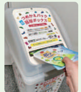
詰めかえパックの回収ボックス

詰めかえパックは、プラスチックボトルなどの削減に大きく貢献する一方で、さまざまな特性を持つ多層構造のフィルムのため、リサイクルには不向きな素材です。このプロジェクトは、行政(神戸市)、小売、日用品メーカー、リサイクラーが協働することで、もう一度詰めかえパックへのリサイクル(フィルムtoフィルム)をめざす、全国に先駆けた取り組みです。