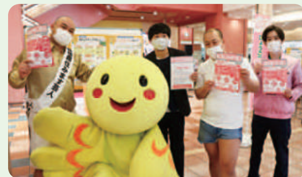
よしもと住みます芸人「モンスーン」のフードドライブの呼びかけ(コープ北口食彩館にて)

※フードドライブ 家庭の余剰食品を、店舗などに持ち寄り、フードバンクなどに寄付する取り組み。