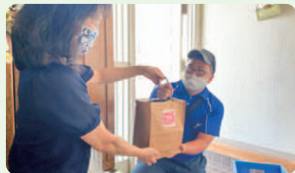
宅配での集中受付キャンペーン

9月には全ての店舗で3日間、全ての宅配センターで2週間の集中受付キャンペーンを開催し、約14トンの食品を回収しました。