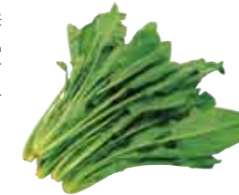
●フードプランおおや高原育ち有機栽培ほうれん草供給高推移

兵庫県養父市大屋町で、農薬や化学肥料を使わず有機栽培で生産されたほうれん草。手で草抜きをしたり、地元の家畜のフンや稲作の副産物のモミガラでつくったたい肥を使うなど、しっかり土づくりをすることで、有機栽培を可能にしています。2007年には第13回環境保全型農業推進コンクールで大賞を受賞するなど、取り組みが高く評価されています。